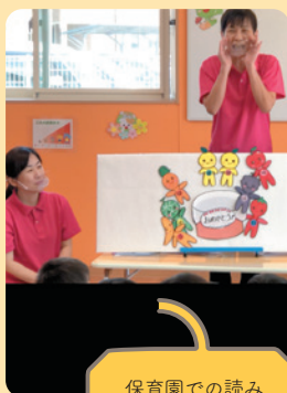
保育園での読み聞かせの様子

医療的ケア児がいる学校や園で、その子の特性に合わせたオリジナル立体絵本を作成し、読み聞かせを実施。(計9回、のべ681人参加)。絵本の仕掛けで、体の仕組みによって医療的なケアが大切な行為であるという理解促進を行いました。園児・児童向けだけでなく、保育士・教職員向けや行政機関に働きかけ、園長・副園長研修会でも理解教育の講義を実施しました。