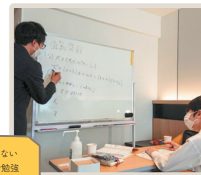
感染症の不安がない レンタルルームで勉強

入院や自宅療養により遅れてしまった学習を支援するために、2017年北海道に団体を設立し、幼児から高校生まで幅広い年代の子どもたちを支援しています。学習支援場所は、札幌市内にあるホテルのレンタルルームなどを利用しています。また、オンラインによる学習支援も併用し、感染症リスクが高い病気の子どもたちが安心して学習できる環境に配慮しています。札幌まで通うことができない遠方に住む子どもたちの支援も開始するなど、学びを止めない活動を続けています。