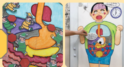
オリジナル 立体絵本の例

香川県内の他地域でも心のバリアフリー活動を広げるため、テキストブックを作成・配布。現場の職員の不安を取り除くために、多くの事例や医療的ケアの特性に応じた情報を掲載。団体への研修依頼も増え、医療的ケア児を積極的に受け入れる学校や自治体が広がりを見せています。