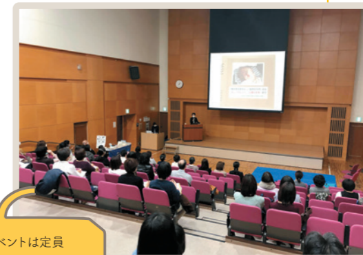
イベントは定員 80名満員で開催

i-care kids 京都が運営する医療的ケア児を積極的に受け入れる小規模保育園「キコレ」では、五感を通じた豊かな『食の体験』を大切に、園庭栽培した野菜を子どもと一緒に収穫、調理するなど、食育プログラムを年間を通して実施しています。「医療的ケア児×食べること」をテーマに実施したシンポジウムでは、医療的ケア児のご家族をはじめ、保育、療育、医療、福祉、教育、行政など多様なバックグラウンドの方々一堂に集まり、医療的ケア児が安心して楽しく「食べる」ことができる環境づくりの必要性を再確認しました。